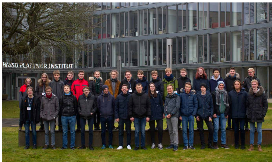
Teilnehmerinnen und Teilnehmer beim Workshop „Fit for BwInf“ des Hasso-Plattner-Instituts

Die 2. Runde erreichen alle, die eigenständig oder im Team drei oder mehr Aufgaben der 1. Runde weitgehend richtig gelöst haben. Für die Endrunde qualifizieren sich die besten bis zu 30 Teilnehmenden der 2. Runde.