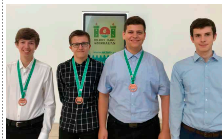
Das deutsche Team bei der IOI 2019 in Aserbaidschan

Die IOI ist die jährlich stattfindende Weltmeisterschaft für den Informatik-Nachwuchs. Aus rund 80 Ländern werden je vier Teilnehmende entsandt, die in zwei Prüfungen innerhalb kurzer Zeit anspruchsvolle algorithmische Probleme bearbeiten und ihre Lösungen in fehlerfreie Programme umsetzen müssen. Als Preise werden mehrere Gold-, Silber- und Bronzemedailles vergeben. BWINF richtet das Auswahlverfahren für das deutsche Team der IOI aus.