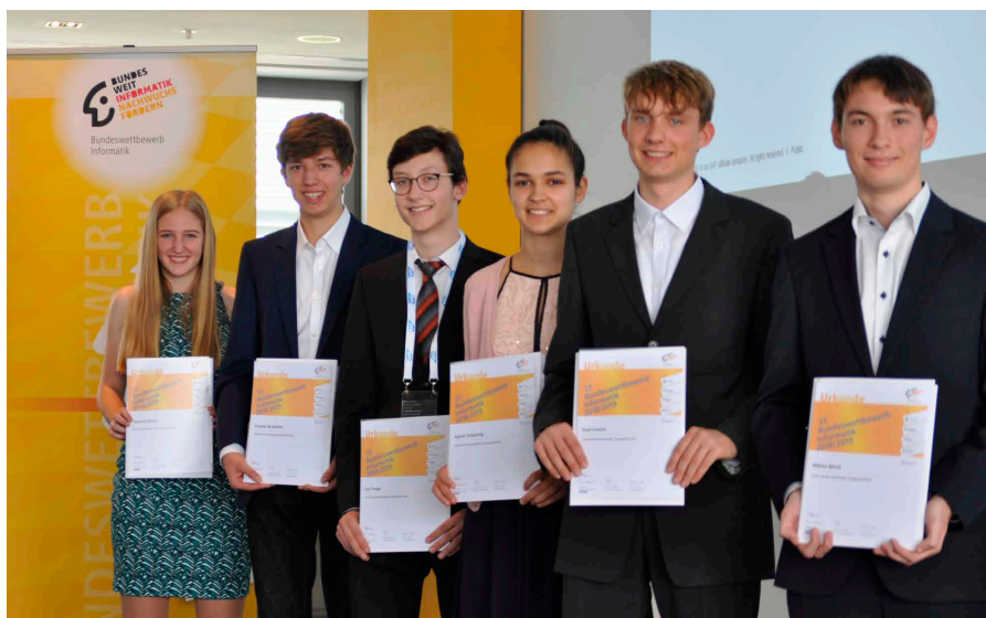
Bundessiegerinnen und Bundessieger des 37. Bundeswettbewerbs Informatik.

Einsendeschluss zur 1. Runde des 39. Bundeswettbewerbs Informatik ist der 23. November 2020